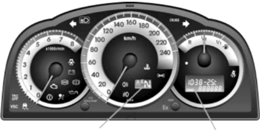
Индикатор режима работы трансмиссии Мультимедийный дисплей